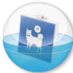
カプセル入れ (コマフレームのみ)