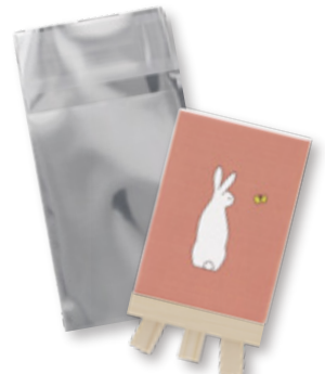
アルミ蒸着袋入れ

UV印刷対応のキャンバス生地を張った、イラストや写真が映える人気のキャンバスアート。