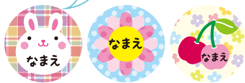
ボタン完成イメージ