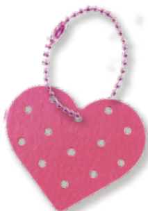
チャーム+チェーン