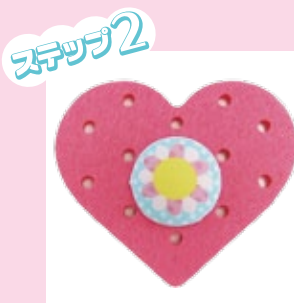
2. フェルトにさしてね。