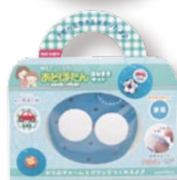
おなまえキット「まる」