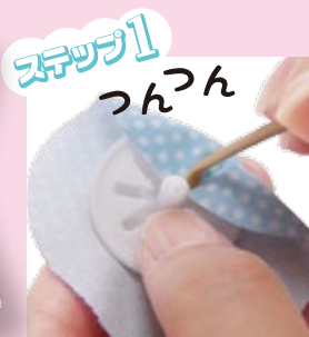
1. スティックでつつん。