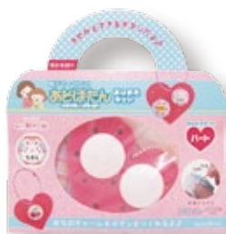
おなまえキット「ハート」