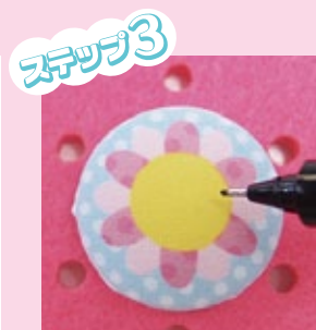
3. 名前をペンでかこう。