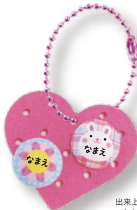
出来上がり イメージ