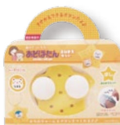
おなまえキット「ほし」