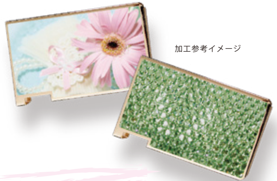
加工参考イメージ

タブレット菓子のミンティア専用ケース。 いつも持ち歩くものだからこそ、 かわいいケースでオシャレに。