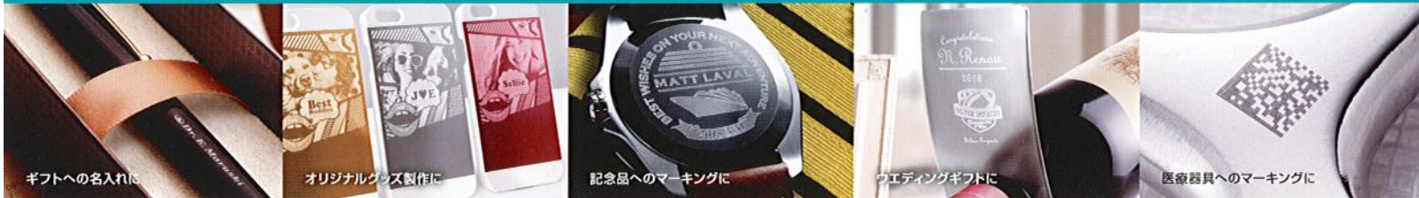
ギフトへの名入れに

また、工業銘板の作成、製品やパーツへのロゴ・文字のマーキング、さらにトレーサビリティのための2次元シンボルのマーキングなど、さまざまな業種・業界で活躍します。